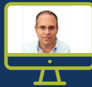
כלים מעולם האימון יהודי