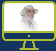
לימודי ההכרה ימימה