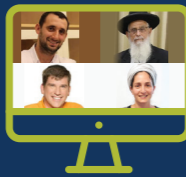
מסע למידה בנושא חינוך פיננסי מזווית יהודית