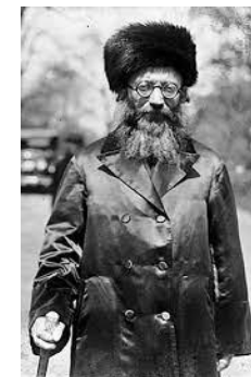
הרב אברהם יצחק הכהן קוק