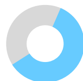
שביעות רצון בביה"ס