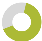
תחושת שייכות לקה"ל