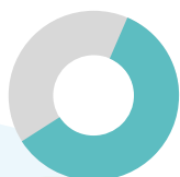
התפתחות אישית ומקצועית